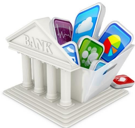
субъект КИИ в банковской сфере и в иных сферах финансового рынка